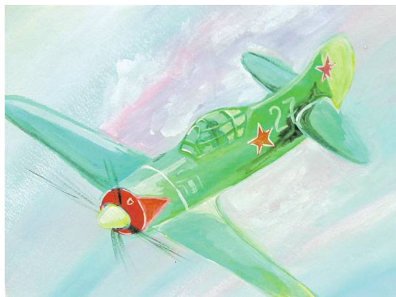
Воздушный бой. Рисунок Дмитрия Новикова (Корочанская школа им. Д. Кромского)