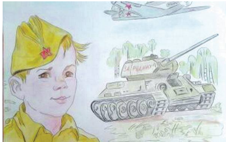
Рисунок Дарьи Лопиной (Корочанская школа им. Д. Кромского)